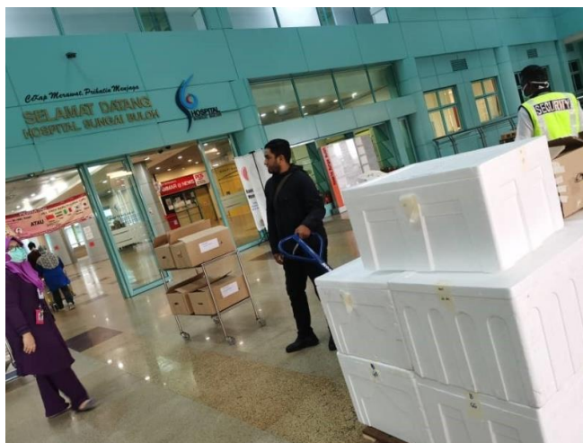
工作人员送餐到双溪毛糯政府医院。