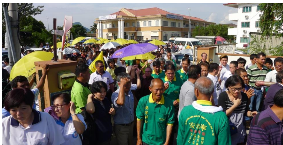
各界人士感念釋空禪法師的奉獻，前來送別他最後一程。