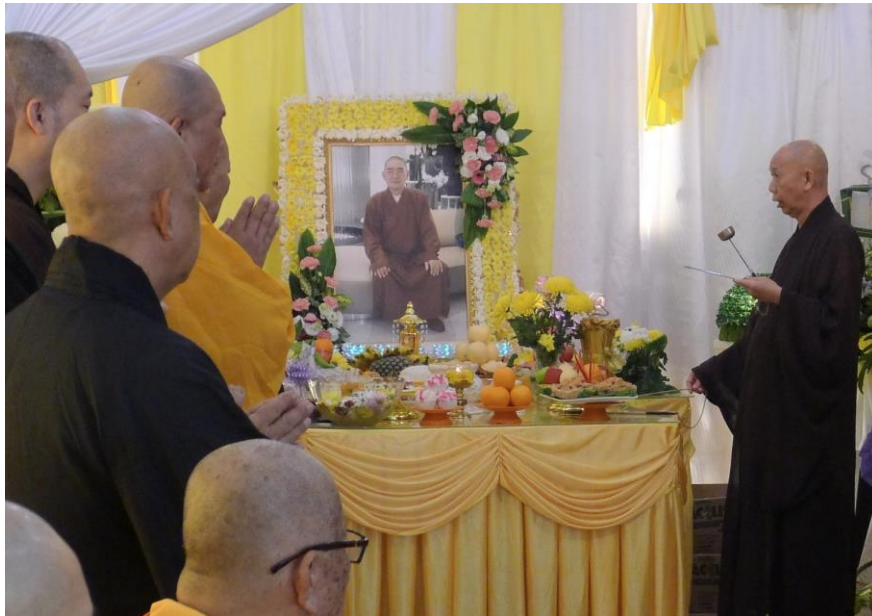
師父們在釋空禪法師靈柩前誦經。